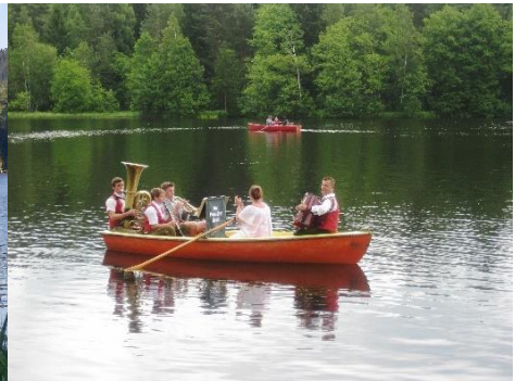
Sommersaison am Nagler See

Am Abend gemütliches Beisammensein auf der Terrasse oder im nahegelegenen Gasthof „zur Mauth“ oder in einer der empfohlenen Wirtschaften. Miet-Kleinbus steht zur Verfügung.