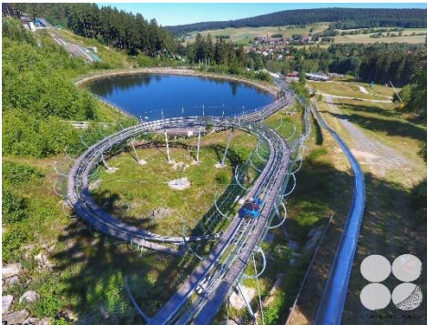
Sommerrodelbahn am Ochsenkopf