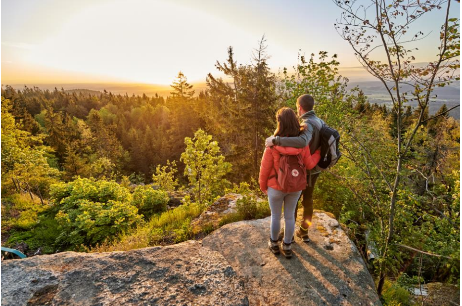
Auf der Kösseine