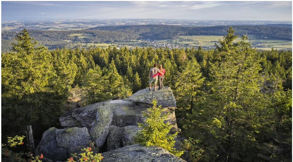
Blick in die unendliche Ferne

(Ähnlich wie bei den Reisemobiltreffen in Lackenhäuser zum Dreisesselberg, nicht ganz so lange Strecke und weniger Höhenmeter). Angepasste Kondition und Trittsicherheit (Wurzelwerk) erforderlich. Abkürzungen bei unpassender Witterung möglich. Hunde willkommen.