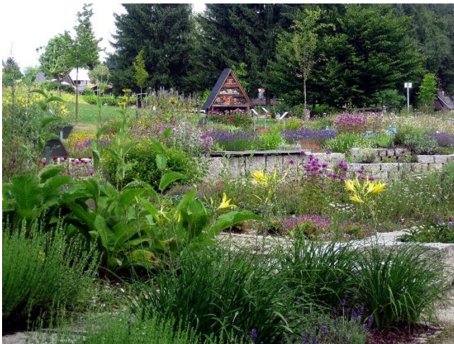
Duft- und Schmetterlingsgarten

Nachmittag zur freien Verfügung. Miet-Kleinbus steht zur Verfügung.