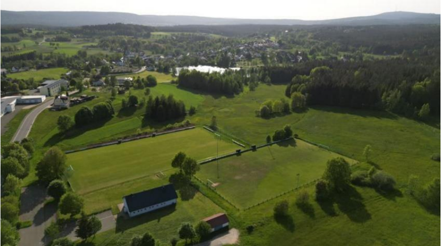
Luftbild Nagel mit See, im Vordergrund das Sportheim des 1. FC Nagel mit der Stellplatzfläche