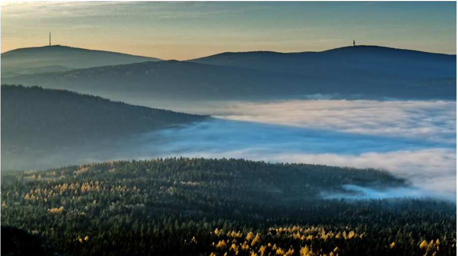
Blick von der Kösseine auf den Ochsenkopf und den Schneeberg

Am Abend nach freier Wahl gemütliches Beisammensein auf der Terrasse des Sportheimes oder Gaststätten nach Wahl (siehe nachstehende Empfehlungen).