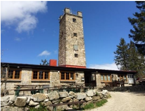
Berggasthaus mit Asenturm auf dem Ochsenkopf