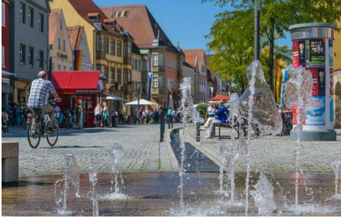
Maximilianstraße