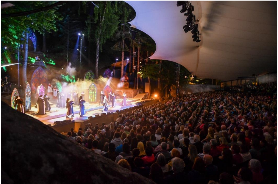
Stimmungsvolle Festspiele auf der Luisenburg in Wunsiedel