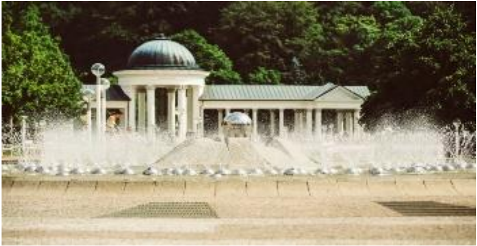
Marienbad, Singender Brunnen