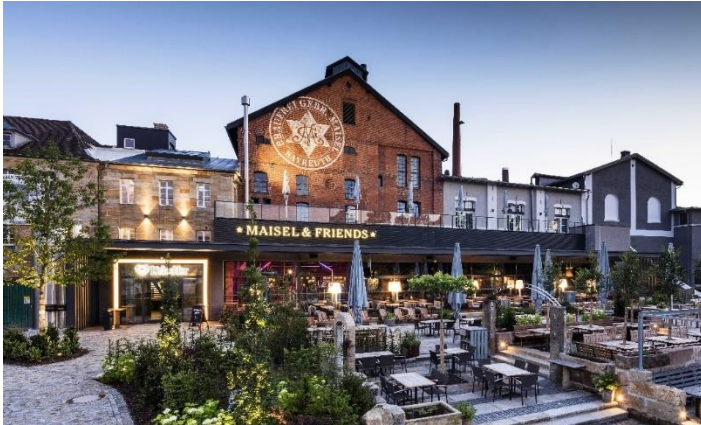
Brauerei Maisel & Friends

15.00 Uhr Maisels Bier- und Erlebniswelt , Kulmbacher Straße 40, (Tel. 0921-401 234) Führung (ca. 1 Stunde) durch die Historische Brauerei Maisel (keine übliche Brauereibesichtigung), Hunde willkommen. Es sind dort Treppen zu begehen! Die Führung endet im Brauereishop bei einem Glas Auswahlbier. Für Freunde einer guten Tasse Kaffee bietet das brauereieigene, kleine Café gegenüber darüber hinaus auch eine Gelegenheit zu verweilen. Möglicher Aufenthalt und Treffpunkt für alle im sehenswerten Restaurant „Liebesbier“ (ellenlange Biertheke) in der Brauerei Maisel, von dort aus Buszustieg.