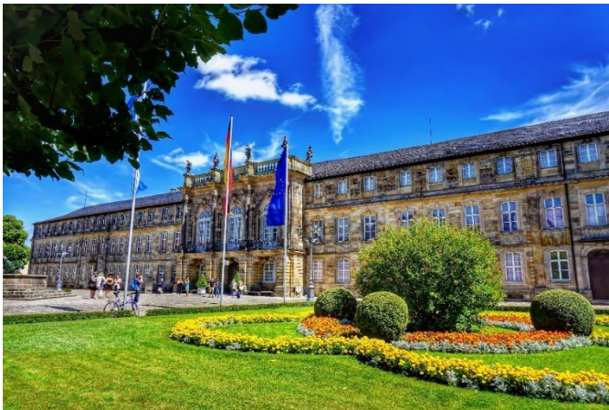
Neues Schloss