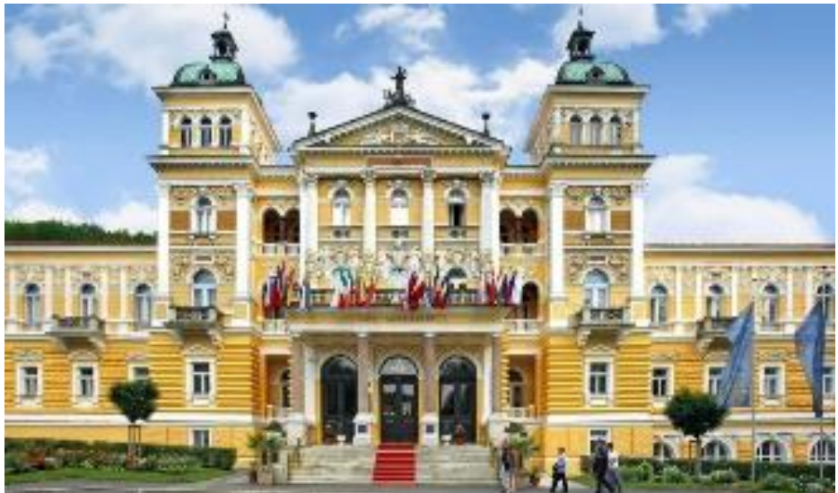
Marienbad, Grand Hotel

15.00 Uhr Rückfahrt ins Kräuterdorf Nagel