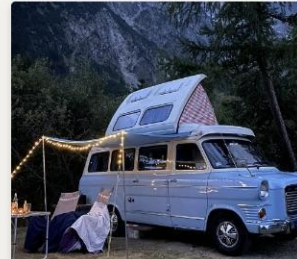
Wölkchen der Ford Transit MK1 DE, Schopfheim 79650, Baden Württemberg ★ Geheimtipp 128,92 € / Nacht