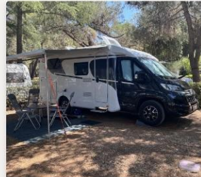
Camper Van Carado V337 Kompaktklasse DE, 01689 Weinböhla, Sachsen ★ Geheimtipp 137,50 € / Nacht