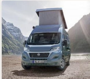
EXPLORER Class KNAUS Boxstar Street oder Road DE, 83026 Rosenheim, Deutschland ★ Geheimtipp 130,90 € / Nacht