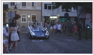
Aircar Prototyp 1.