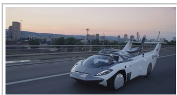
Aircar Prototyp 1.