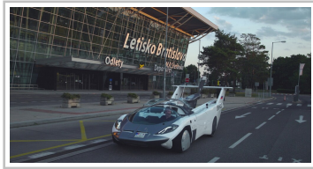
Aircar Prototyp 1.