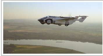
Aircar Prototyp 1.