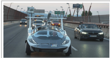
Aircar Prototyp 1.