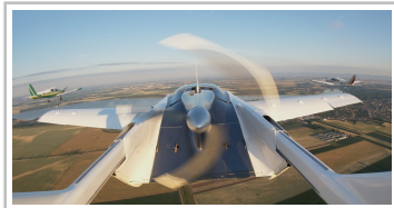
Aircar Prototyp 1.