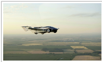
Aircar Prototyp 1.