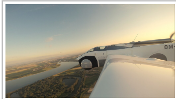
Aircar Prototyp 1.