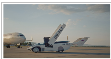
Aircar Prototyp 1.