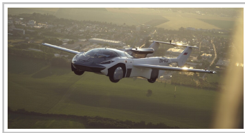
Aircar Prototyp 1.