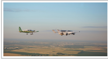
Aircar Prototyp 1.