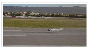
Aircar Prototyp 1.